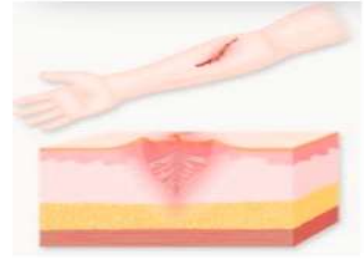
열상 / 찢긴상처