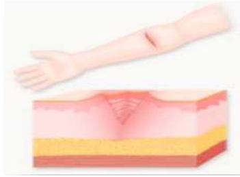
절상 / 베인상처