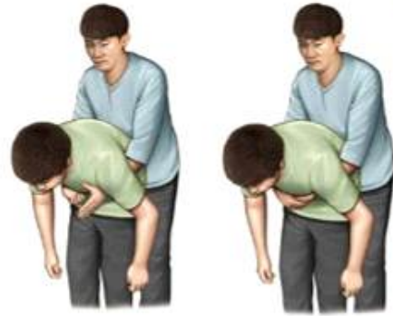
복부 밀어내기 (하임리히 법)