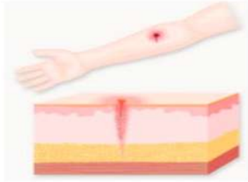
자상 / 찢린상처